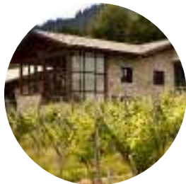
Señorio de Astobiza