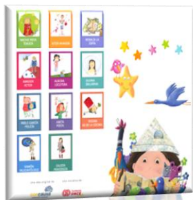
CUENTOS QUE ILUSIONAN-ONCE

El objetivo de esta colección de lecturas es mostrar las vivencias de niños y niñas con discapacidad a través de sus divertidas aventuras .