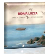
BIDAIA LUZEA Daniel Chambers/Federico delicado

Hau aldi berean gertatzen diren bi bidaiaren istorioa dugu.