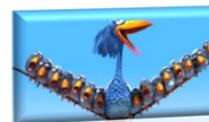
FOR THE BIRDS

https://www.youtube.com/watch?v=va2ZesGgbTQ