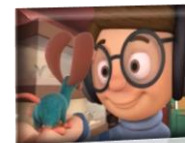
RATÓN EN VENTA

https://www.youtube.com/watch?v=qzX_nbF6pfQ